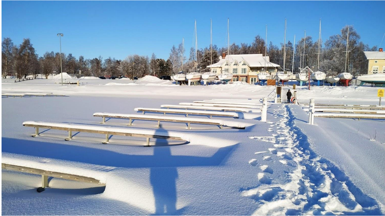
2 Czako Áhím_Kemi_tengerpart_2021

befagyott Botteni-öböl hófedte jegén is sokat túráztunk, közeli szigetekre, félszigetekre. Az egyetem épülete azonban már nem volt ilyen közel. A tömegközlekedés nem túl fejlett a városban, így szinte minden nap gyalog mentünk be az egyetemre, még ha ez a téli hónapokban akár -20 fok körüli hőmérsékletben vagy éppen hófúvásban volt.