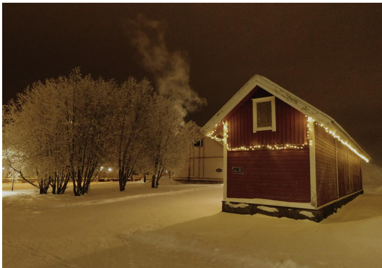
1 Czako Áhím_Kemi_vasut_2021

Az egyetemről négyen utaztunk ki Finnországba, még az utazás előtt felvettük a kapcsolatot egymással, így kezdtük el az utazást szervezni. Hamar kiderült, hogy Helsinkiiig a legjobb mód a repülő, azonban onnan még további 700 km-t meg kell tennünk, hogy eljussunk Kemibe. Erre van lehetőség vonattal vagy repülővel. Ketten úgy döntöttünk, hogy Oulu-ig közvetlen járáttal tovább repülünk, ahonnan már csak egy másfél órás vonatút választott el minket célunktól. Január 4-én este értünk Kemibe, ahol a vidéki kisváros gyönyörűen kivilágított vasútállomása várt minket, mintha egy karácsonyi képeslapba csöppentünk volna. Az állomáson az egyetem által kiküldött taxiba szálltunk, ami elvitt bennünket a szálláshelyünkre. Itt már három ottani hallgató fogadott minket lelkesen. Elmondták az alapvető tudnivalókat a szállásunkról és a városról.