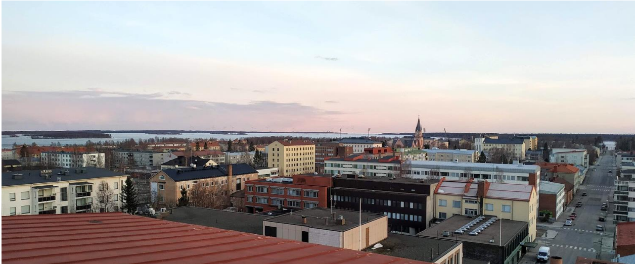
3 Czakó Áhím_Kemi_2021

Egészen véletlenül választottam ezt az egyetemet, az ország vonzott, az intézményről az utazás előtt nem sokat tudtam, de hamar kiderült, hogy jó választás volt. Az egyetem 2014-ben jött létre több korábbi egyetem összevonásával. Egy nagyon modern kampusza van Kemiben, ahol tényleg szívesen töltöttük a napjainkat, akár késő délutánokig. Pedig kontakt óránk alig volt néhány a félév során, részben a covid helyzet miatt, de főként mivel projekt alapú oktatásban volt részünk. Sok anyagot magunknak kellett feldolgoznunk, a számonkérések pedig néhány hagyományos teszt vagy vizsga mellett, inkább összetettebb projektek önálló kivitelezésével történtek. Ezeken a projekteken az egyetem laboratóriumaiban tudtunk szabadon dolgozni a hét bármelyik napján, hiszen szabadon bejárhattunk a termekben, tanári felügyelet nélkül, legyen az 3D nyomtató labor, műhely, vagy CAD labor. Ilyen körülmények között sok motivációval dolgozhattunk a feladatainkon, ha kérdésünk volt bármikor jelezhattük a tanáraink felé, azonban sokszor inkább egymást segítettük, mint hallgatók. Szinte fel sem tűnt így hogy mennyi munkát áldoztunk egy-egy projektre, és mennyit tanultunk így belőle.