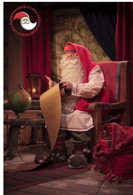
Mikulás az irodájában