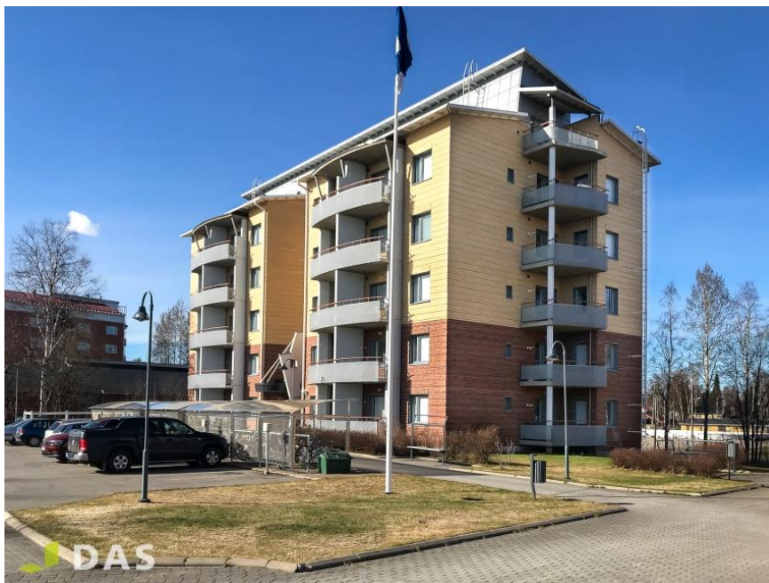
Az épület, amiben laktam

Mivel egy tanulmányi félévet már eltöltöttem korábban Erasmus+ ösztöndíjjal Rovaniemiben, így voltak ismerőseim a városban. Végül egy barátommal laktam együtt, aki diák révén diákszállást kapott az ottani cégtől (DAS), így a finn árakhoz képest aránylag olcsón sikerült szállást kapni. A szállás természetesen az egyetemhez közel helyezkedett el, ahonnan minden könnyen elérhető volt.