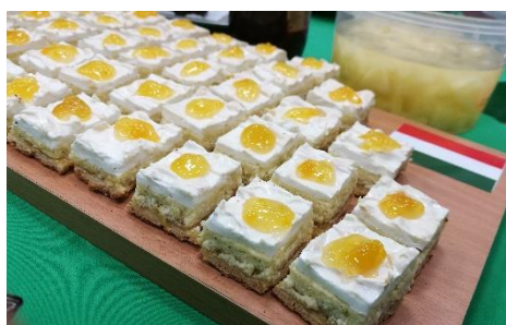
Bizonyíték arra, hogy kollégiumban is lehet Rákóczi túrós sütni

Az egyetemnek 4, javarészt jól felszerelt kollégiuma van, így a szálláskereséssel nem kell bajlódni. Az én szobám a „Zaścianek” névre hallgató épület első emeletén volt, mely híresen-hírhedten közösségi helyként ismert. A szobák kétágyasok voltak, hűtővel, mosdóval, ágygal felszerelve, emeletenként pedig 2-2 konyha elégítette ki azon kevesek igényeit, akik magukra szerettek volna főzni. A szobatársammal mázlim volt, egy kedves, csendes lengyel leányzóval utaltak minket ki egymásnak.