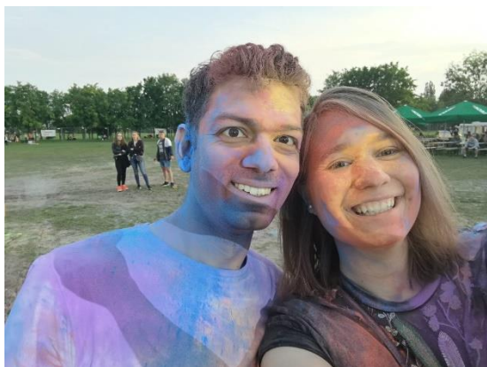
Holi az éves diákfesztiválon

Az óralátogatásokon felül mentoraink különféle programokkal színesítették a hétköznapokat. Volt itt a nyitóbulin felül karaoke est, társalgási est helyiekkel, spontán BBQ parti, trambulín-party, közös filmezések, hajókirándulás... Igazán nem volt okunk panaszra.