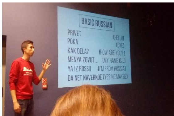
Képek az orosz kultúrestről. Bal oldalon kozachok, jobb oldalon rapid nyelvoktatás

A legkedvesebb hely számomra Opolében az Idegennyelvű könyvtár volt. A fantasztikus könyvállományon felül ami igazán lenyűgözött, hogy a könyvtár vezetősége aktívan bevonja az opolei külföldi hallgatókat a mindennapi életbe. Hogy hogyan? Ingyenes idegennyelv-oktatással, táncoktatással, kultúrprogramokkal, napjában 4-5 alkalommal. Részt vettem lengyel, spanyol, francia, arab, gujarati, perzsa nyelvórákon (mindet anyanyelvű barátaim tanították), kreatív terápiás workshopon, keleti táncórákon, tai chin, Indiát bemutató előadásorozaton, koncerten és még sok máson.