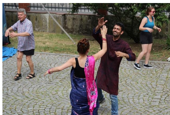
Indiai néptánc oktatás a nyelvi fesztiválon