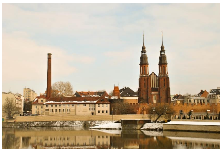
Az Opolei katedrális az Odera túlfeléről

Maga a város: mintha egybe sűrítették volna Velencét, Kőbányát és Debrecent, majd megfűszerezték volna egy kis Budakeszivel. Kis távok választják el egymástól a gyönyörű Odera partját és a környéki erdőket, külvárosi lakásokat és kollégiumokat, valamint a könyvtárt, a belváros szórakozóhelyeit. Ha van kerékpárod, szinte minden közel van (beleértve egy Natura 2000 területen fekvő tóvidéket is).