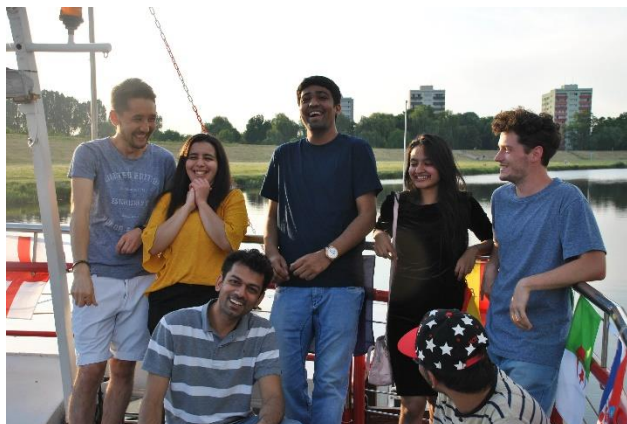
Legkedvesebb barátaim kaja a hajótúrán