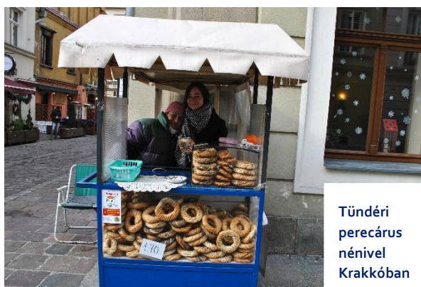
Tündéri pencárus nénivel Krakkóban

Mentorommal kialakult barátságunk révén együtt ünnepelhettem vele és családjával a Húsvétot igazi lengyel módon, megismertették velem a lengyel konyhát (ami meglepő módon nem csak a híres pierogit takarta).