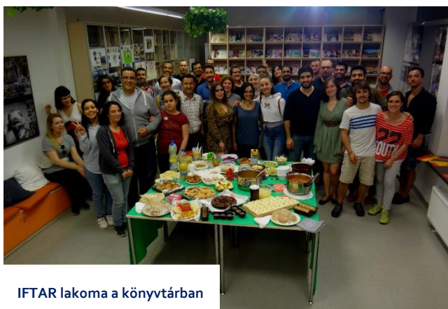
IFTAR lakoma a könyvtárban

A legkedvesebb hely számomra Opolében az Idegennyelvű könyvtár volt. A fantasztikus könyvállományon felül ami igazán lenyűgözött, hogy a könyvtár vezetősége aktívan bevonja az opolei külföldi hallgatókat a mindennapi életbe. Hogy hogyan? Ingyenes idegennyelv-oktatással, táncoktatással, kultúrprogramokkal, napjában 4-5 alkalommal. Részt vettem lengyel, spanyol, francia, arab, gujarati, perzsa nyelvórákon (mindet anyanyelvű barátaim tanították), kreatív terápiás workshopon, keleti táncórákon, tai chin, Indiát bemutató előadásorozaton, koncerten és még sok máson.