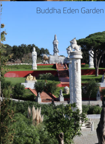
Buddha Eden Garden