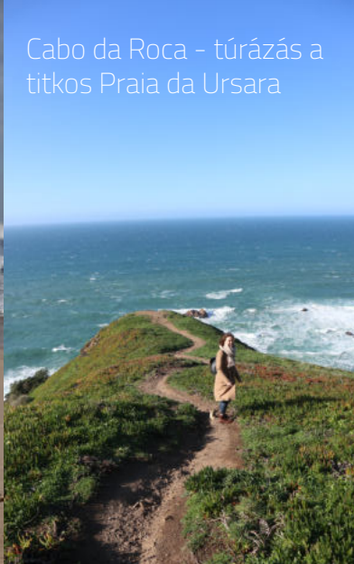
Cabo da Roca - túrázás a titkos Praia da Ursara