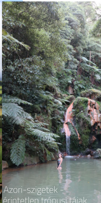
Sao Miguel, Azori-szigetek - csodálatos, érintetlen trópusi tájak, fürdőzés a dzsungelban, rengeteg vízesés