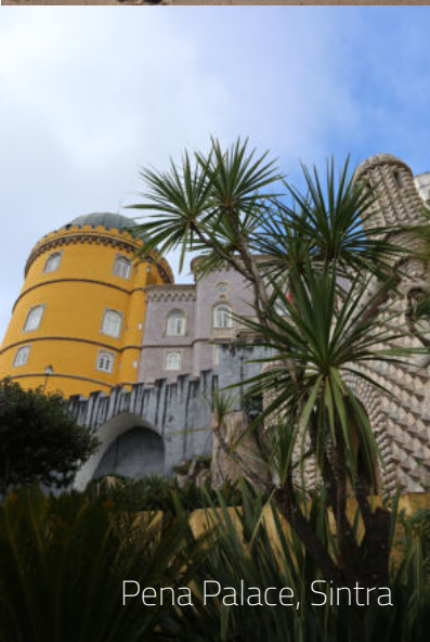
Pena Palace, Sintra