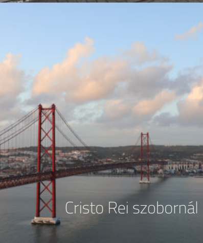
Cristo Rei szobornál