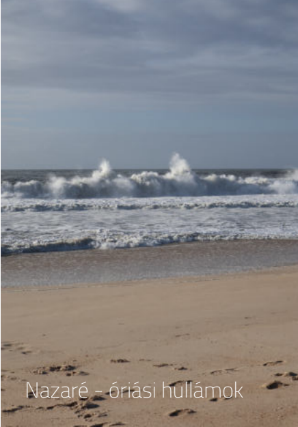
Nazaré - óriási hullámok