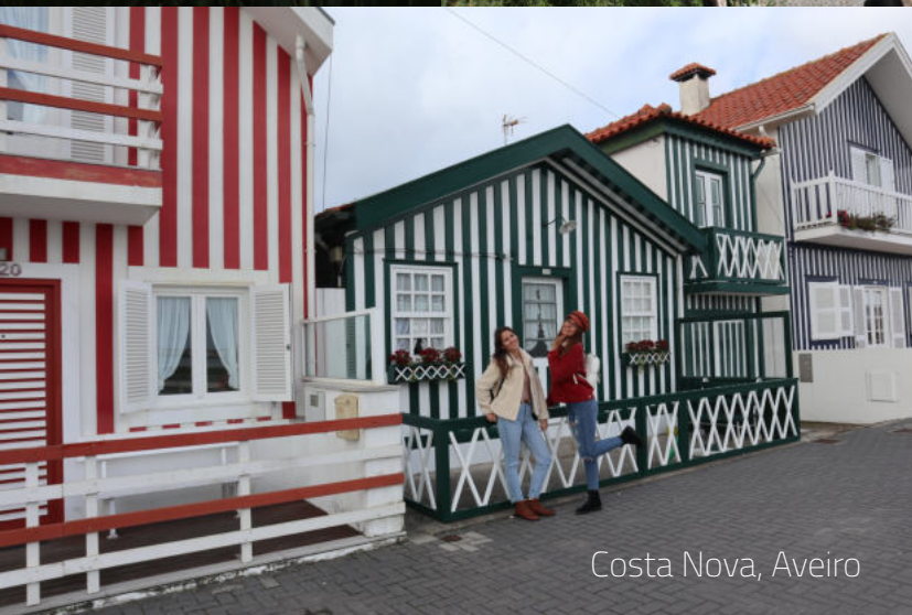
Costa Nova, Aveiro