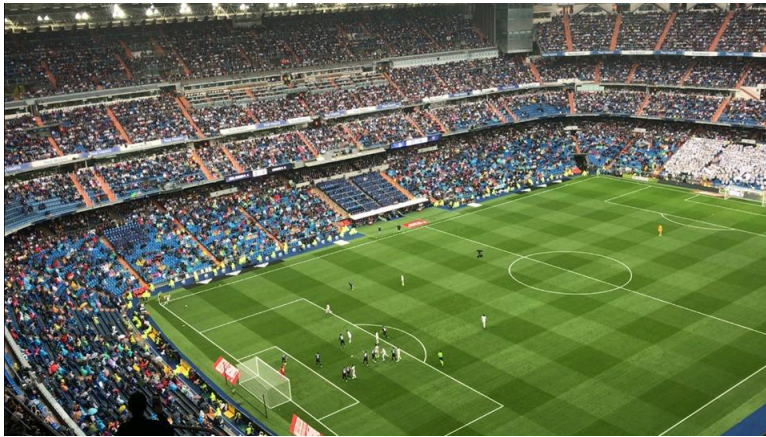
Egy meccs a Santiago Bernabeuban

A tömegközlekedés elképesztően jó . Összesen 13 metróvonal és számos „hév” vonal található a városban, ami teljesen lefedi a bel- és külvárosi részeket is, így kvázi nincs szükség más tömegközlekedési eszközre. A diákok havi 20€-ért használhatják korlátlanul ezeket a járműveket, amelyekre egy plasztik kártyával (abono joven) lehet felszállni. Ezt érdemes megrendelni még a kiutazás