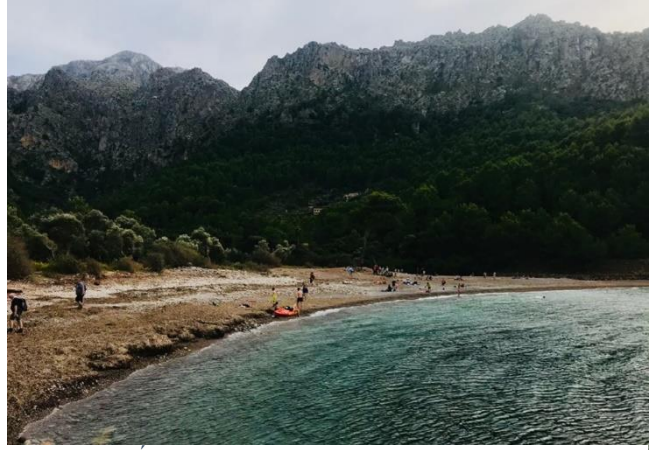
Életünk egyik legjobb utazása: Mallorca

Utazzatok ti is! Együtt olcsóbb és sokkal emlékezetesebb is a túra, higgyétek el: soha nem fogjátok elfelejteni ezeket az utakat.