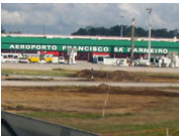
A portói reptér

Frankfurtban öt órát kellett várnom az átszállásra, de így legalább nem aggódtam Európa legnagyobb repterén, hogy lekésem a portói gépet. Az átépítés alatt álló portói reptér valóban egy dél-amerikai banánköztársaság benyomását kelti, ahogy ezt egy internetes fórumon olvastam. Nem vár senki, csak a kollégium címét tudom. Taxira nem akarok költeni 12-16 eurót, és különben is zsebemben a kinyomtatott " bky " térkép. Az "AeroBus" vezetője szerencsére beszél angolul, elmondja, hogy a buszon vett 2.60 eurós jeggyel egész nap utazhatok, és hogy majd szól, hol szálljak le. A végállomáson szól, ami a Praça Liberdade-n van. Ez a központban van, és rengeteg busz indul innen. Én a 79-est választom, mert ennek van megállója a kollégium utcájában. Rossz döntés volt. Nem vettem észre a sok kerülőt a térképen, ráadásul mindenki az FC Porto meccsre igyekszik - természetesen kocsival - így a szűk utcákban 0,5 km/h sebességgel lehet haladni.