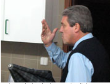
A portás barátságosan közli, hogy a látogatási időnek 11-kor vége

persze két óra után is vizesen vehetem ki a ruhám.