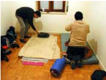
Első éjszaka az albérletben