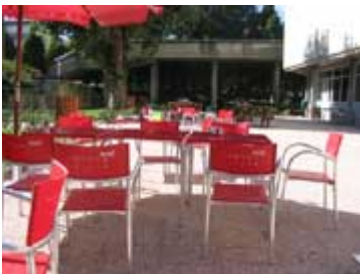
Terasz a kantinnál

Alexandra irodájából még megbeszélek egy találkozót a projektvezetőmmel telefonon.