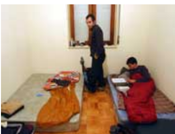
A vadi új second-hand ágyunk

Oldalt a fotó nem vicc: kiderült, hogy nincsen "igazi" mosógép. A Lonely Planetben megtaláltuk a legolcsóbb mosodát. 3 euróért 6 kiló ruhát mosnak ki, a szárítás +3 euró. Esős heteken ez praktikus.