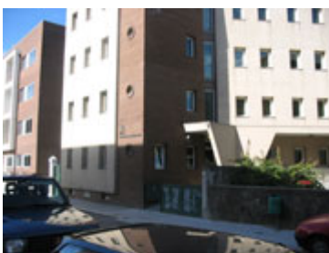
Kollégium, Rua Coronel Almeida Valente 330

A kollégium gyalog öt percre van az iskolától, viszont a központtól busszal 45-60 percre, a forgalomtól függően. Havi 90 euróba kerül, plusz 90 euró kaució. A szobák a magyar viszonyoknál jobbak, a németnél rosszabbak. Egy szobában ketten laknak, és a szobából nyílik a zuhanyzó, amit a csak a szomszédokkal kell megosztani. Az ERASMUS-osok egy szobába kerülnek, én egy spanyol srácot fogtam ki. Szerencsém volt, mert ő beszél a "Basic English"-t. Ez három, de leginkább egy igeidőre korlátozódik.