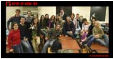
A nyelvtanfolyam vége

Elkezdődött a 30 órás nyelvtanfolyam. Az első órán angolul beszélünk, bemutatkozunk. Van itt svéd, osztrák, görög, Belgiumba települt Hong-Kongi, gall, katalán, olasz, spanyol, német. Itt ismerkedem meg a legjobb barátaimmal. Maga az óra borzalmas: a spanyolok spanyolul, az olaszok olaszul, a tanárnő pedig portugálul beszél, mi pedig egy kukkot sem értünk, és könyörgünk, hogy közben fordítsa is angolra, valamint írja fel a táblára a szavakat, mert a kiejtésre egy percet sem pazarolt, így fogalmunk sincs, hogyan kell írni. Én 4 órát vettem még Pesten magántanártól, és az órán már nem is ragad rám több a "Como te chamas? - Chamo me Marcell"-nél. Az egyetlen jó, hogy új barátokat szerzek itt.